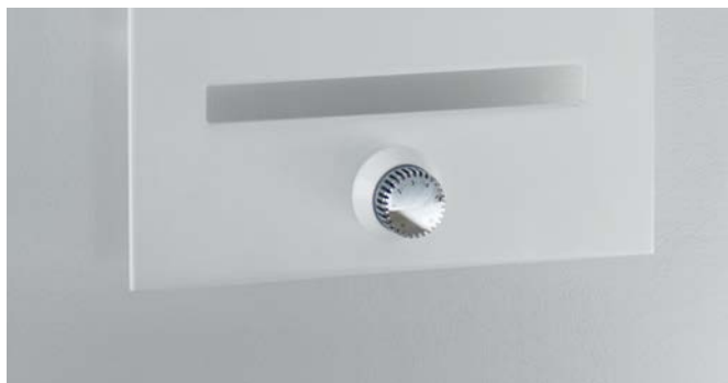
Wersja Completo z wbudowanym zaworem